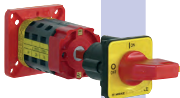
Abmessungen / Dimensions Bauform / Design: 0288-EV / 0288-EVS

handle/front plate red/yellow rd/ye (with Emergency-off function) or black/silver bk/si